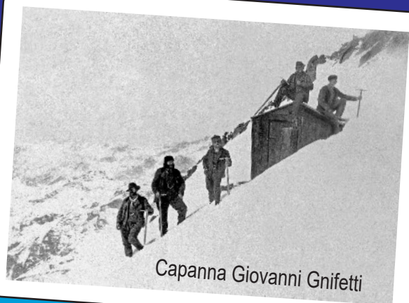
Capanna Giovanni Gnifetti